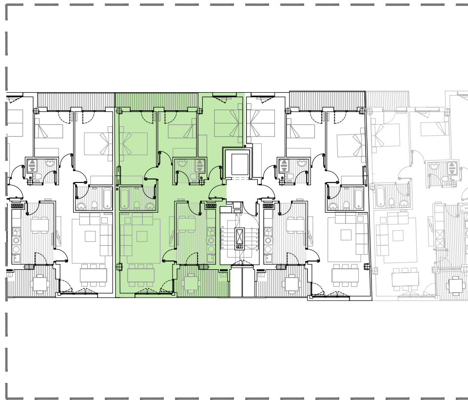
PR 10 ITURRIALDEA 18 1-2-3-4 SOLAIRUA