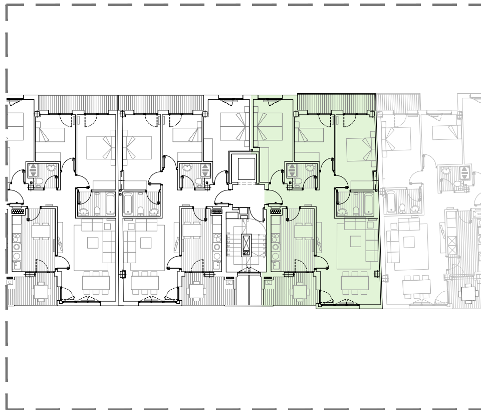
PR 10 ITURRIALDEA 18 1-2-3-4 SOLAIRUA