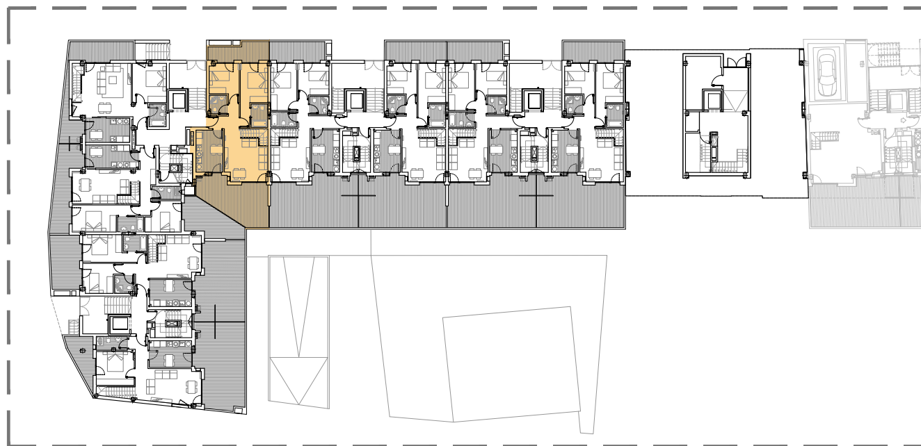
PR 9 ITURRIALDEA 24 BEHE SOLAIRUA